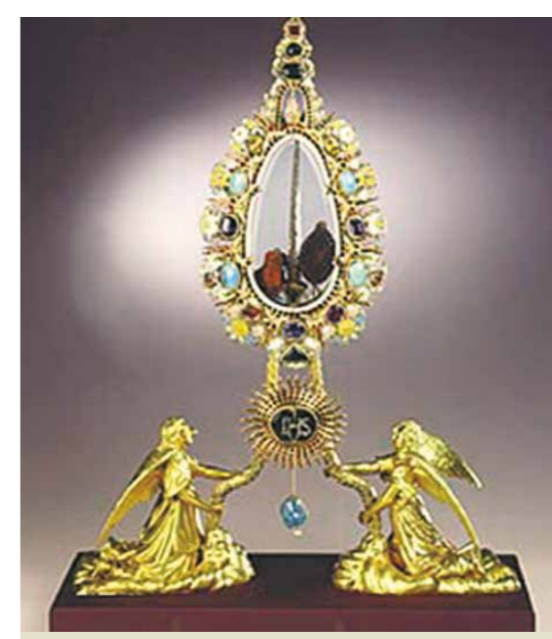
Relique d'un clou de la Croix. Hofburg - Vienne.