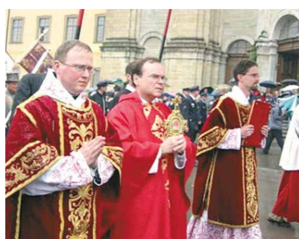
Procession en l'honneur de la sainte relique