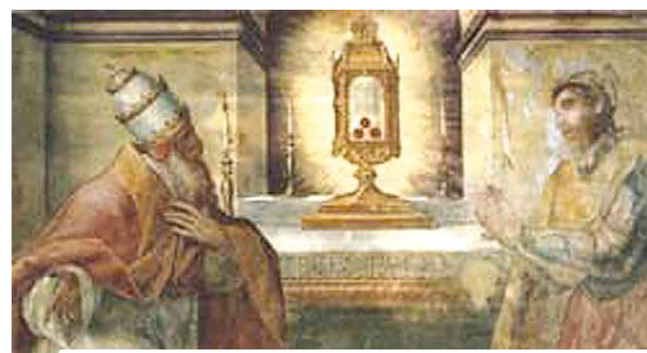
Le Pape Pie II vénère la précieuse relique

année, à Weingarten on organise en l'honneur de la relique une cérémonie, dite la « Chevauchée du Sang ». Il s'agit d'un défilé auquel participent presque 3000 chevaux montés par les personnalités de chaque paroisse de la contrée et par le clergé de chaque église.