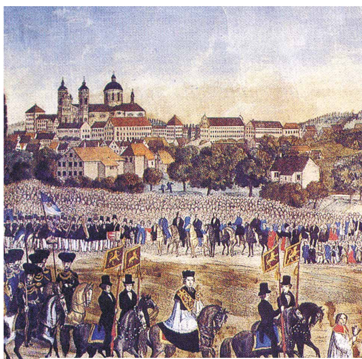
Peinture ancienne où est représentée la Chevauchée du sang qui eut lieu à Weingarten