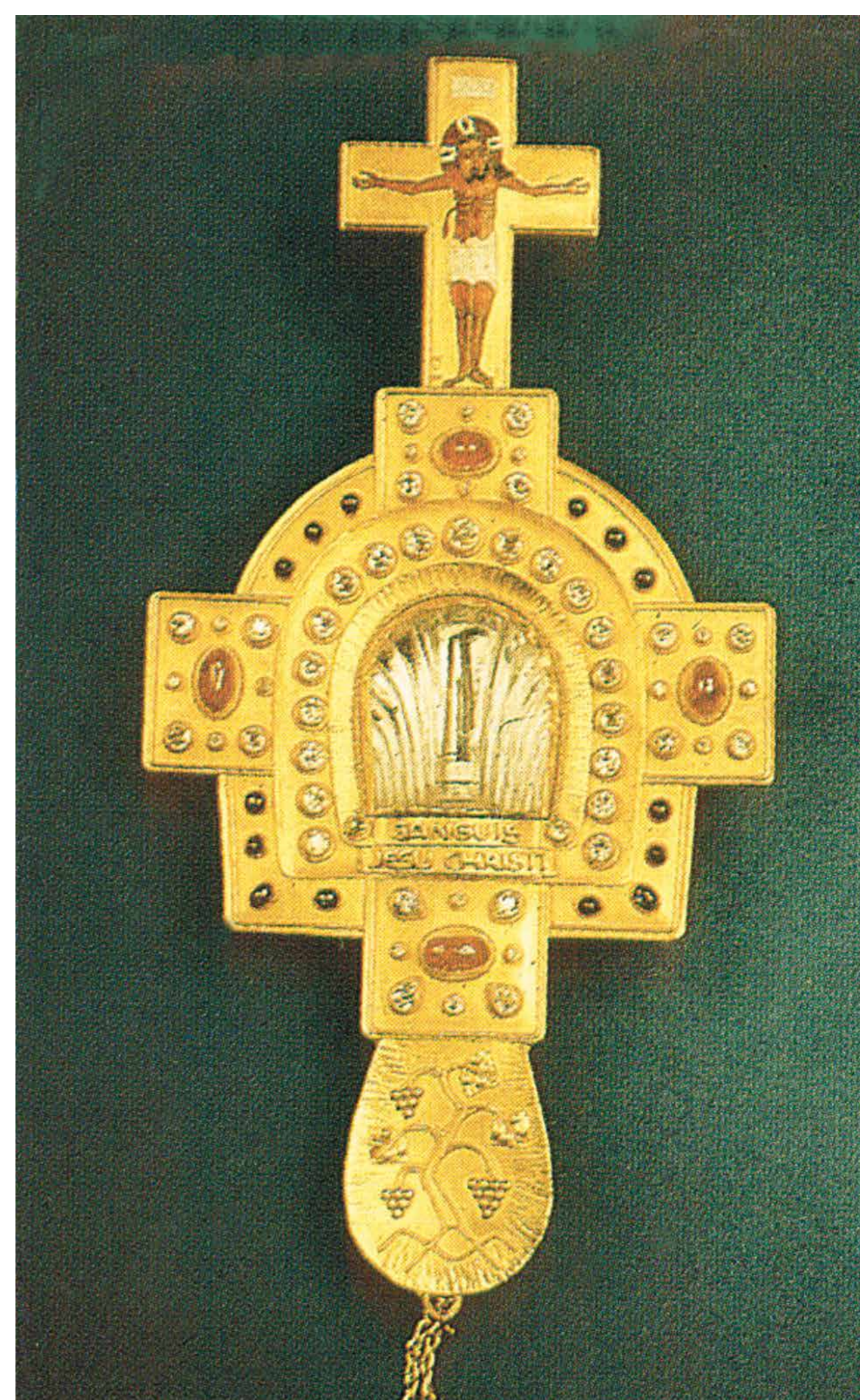
Relique du Saint Sang