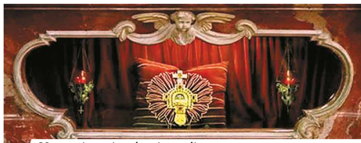
Urne qui contient la sainte relique

À Weingarten, dans le monastère bénédictin, l'on peut vénérer depuis plus de 900 ans, la relique d'une partie du Saint Sang de Jésus. Selon de nombreux historiens, le soldat Longin porta à Mantoue la relique du Saint Sang du Christ, qui fut par la suite partagée et donnée à différents potentats de l'époque (le plus connu est Charlemagne) et à plusieurs papes.