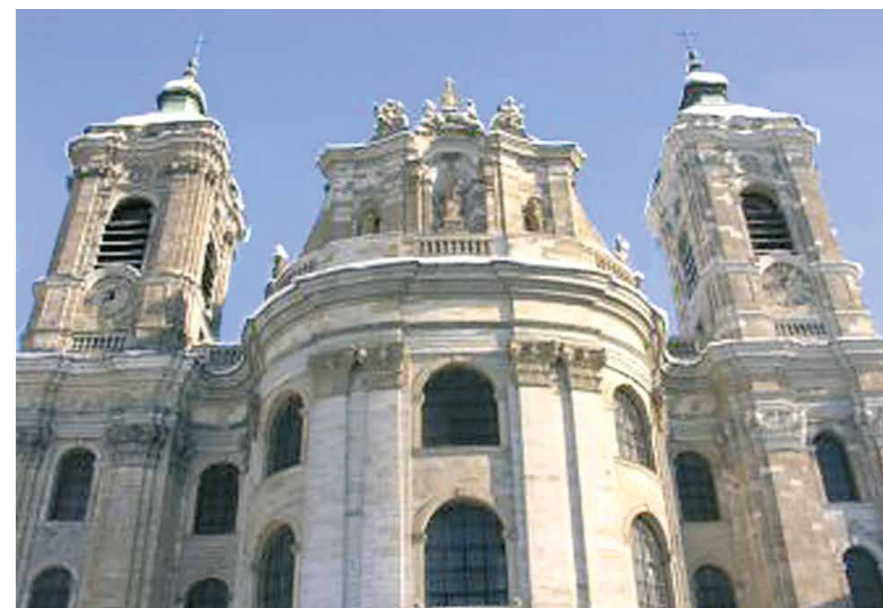
Dans l'église Saint-Martin à Weingarten on conserve la précieuse relique du Saint Sang du Christ.