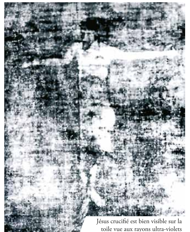
Jésus crucifié est bien visible sur la toile vue aux rayons ultra-violets

siècles il fut représenté par de nombreux artistes. La basilique actuelle fut construite entre 1698 et 1718 par Franz Lothar von Schönborn, archevêque de Mainz. En 1962 le pape Jean XXIII l'éleva au rang de basilique mineure, dirigée ensuite depuis 1938 par les moines Augustiniens.