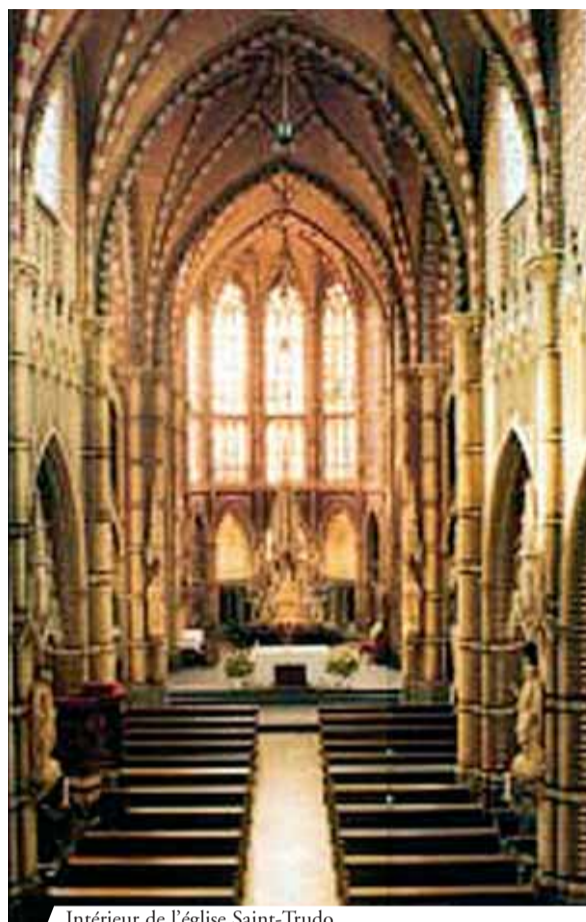
Intérieur de l'église Saint-Trudo

Dans le miracle eucharistique de Stiphout, les hosties consacrées furent préservées d'un violent incendie qui détruisit toute l'église. Celle-ci fut par la suite reconstruite. De nombreux documents décrivent le prodige ainsi qu'une peinture où est représenté l'épisode miraculeux que l'on peut admirer dans l'église paroissiale. Cet événement est rappelé chaque année par les citoyens de Stiphout le jour de la Fête-Dieu.