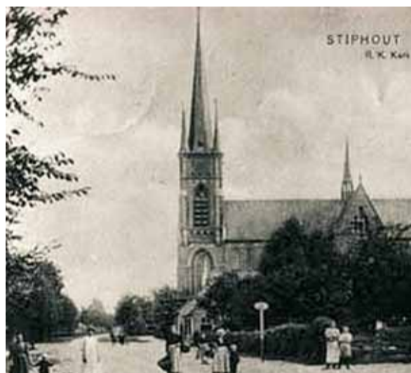
Église Saint-Trudo, Stiphout