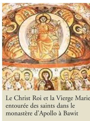
Le Christ Roi et la Vierge Marie entourée des saints dans le monastère d'Apollo à Bawit