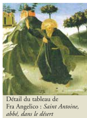
Détail du tableau de Fra Angelico : Saint Antoine, abbé, dans le désert