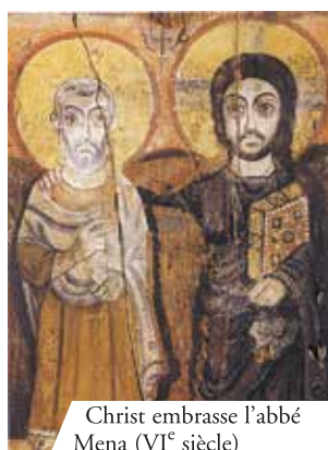
Christ embrasse l'abbé Mena (VI e siècle)