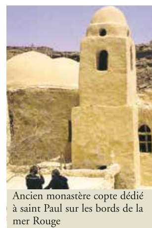
Ancien monastère copte dédié à saint Paul sur les bords de la mer Rouge