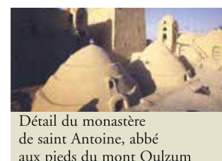
Détail du monastère de saint Antoine, abbé aux pieds du mont Qulzum