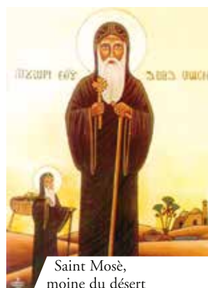
Saint Mosè, moine du désert