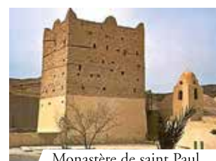
Monastère de saint Paul