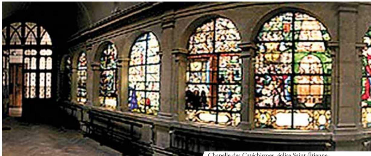
Chapelle des Catéchismes, église Saint-Étienne

Désespéré il la jeta dans l'eau bouillante et vit que l'hostie se soulevait en l'air, prenant l'aspect d'un crucifix.