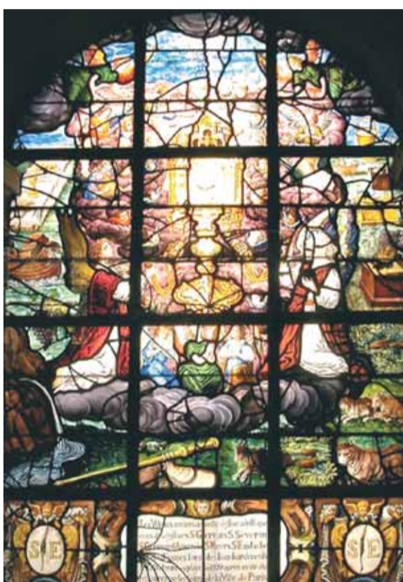
Le triomphe de l'Eucharistie