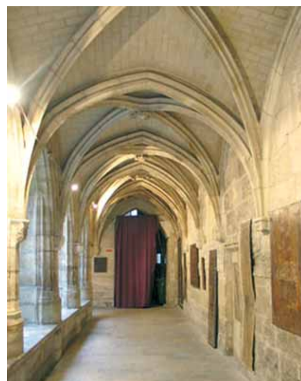
Cloître des Billettes, devenu aujourd'hui une église protestante