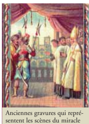
Anciennes gravures qui représentent les scènes du miracle