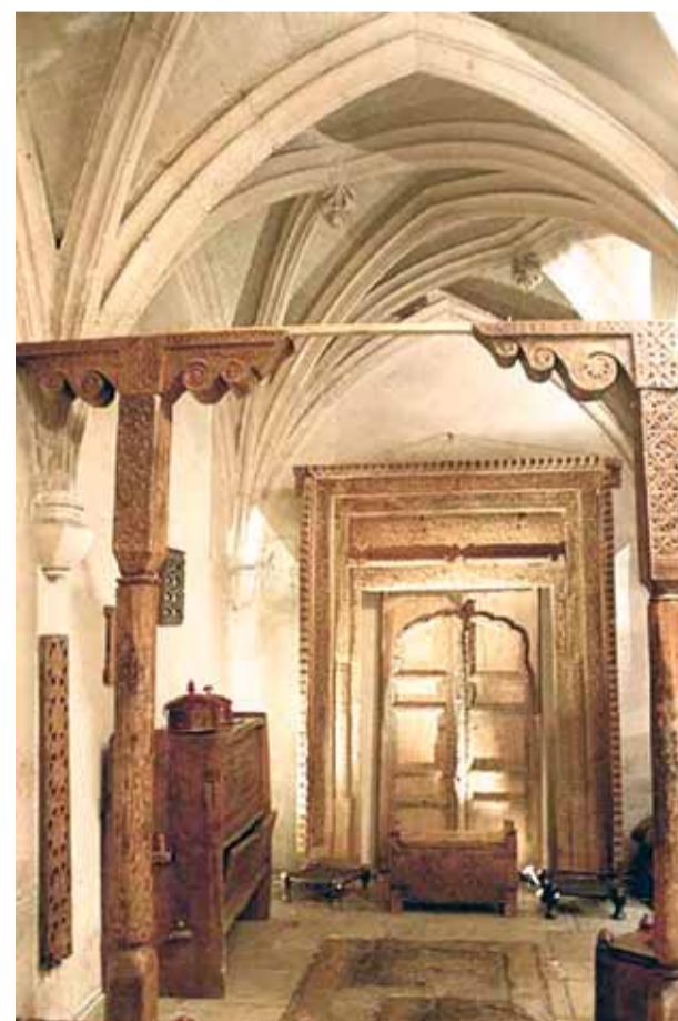
Intérieur du cloître de l'église des Billettes