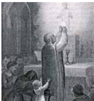
Gravure ancienne représentant le miracle

L'élection du pape Urbain VI (18 avril 1378) fut durement contestée par les cardinaux français dans l'espoir de transférer à nouveau le siège papal à Avignon. Après de nombreuses péripéties, le 20 septembre 1378, ils élirent l'antipape Clément VII. Les cardinaux schismatiques tentèrent aussitôt de s'emparer de Rome, avec l'emploi des armes, mais sans succès et se retirèrent en Avignon où Clément VII continua à agir comme s'il était le pape légitime. Pendant cette période de grandes incertitudes, un prêtre de Moncada, Mosén Jaime Carros, vivait un tourment : son ordination sacerdotale était-elle valable ou non, vu qu'il avait été consacré par un évêque nommé par l'antipape Clément VII ? Chaque fois qu'il disait la messe, il était assailli par la terreur de tromper les fidèles et de distribuer des hosties non consacrées ; il craignait aussi que tous les autres