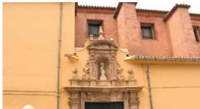
Église où a eu lieu le miracle