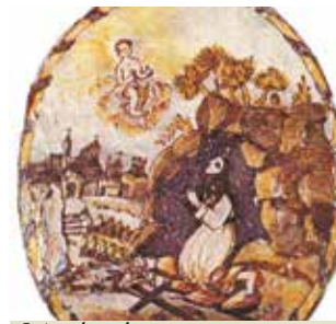
Inès, dans la grotte où elle vécut en ermite