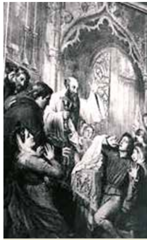
Tableau représentant le prodige église Saint-Jacques, Louvain