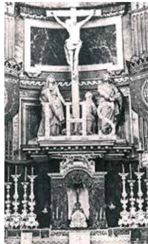
Autel où survint le miracle