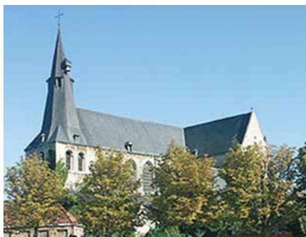
Église Saint-Jacques, Louvain