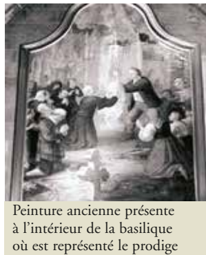
Peinture ancienne présente à l'intérieur de la basilique où est représenté le prodige