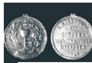
Médailles commémoratives du miracle