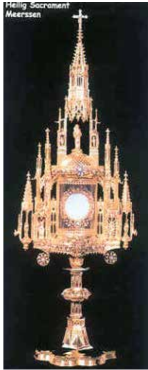
Hellig Sacrament Meerssen

Dans la petite ville de Meerssen en 1222 et en 1465 eurent lieu deux importants miracles eucharistiques. Au cours du premier prodige, pendant la sainte messe, du sang frais jaillit de la grande hostie et tacha le corporal. Pendant le deuxième miracle, en 1465, un paysan sauva la relique du miracle d'un incendie qui détruisit toute l'église. Celle-ci fut reconstruite et en 1938 le pape Pie XI la déclara basilique mineure. Chaque année de nombreux pèlerins vont en pèlerinage à Meerssen vénérer la relique du miracle.