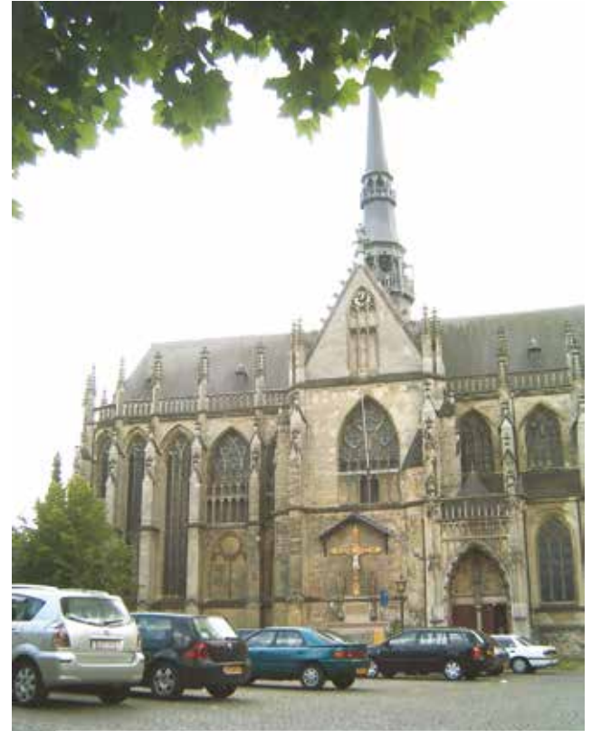
Basilique du Saint-Sacrement