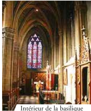
Intérieur de la basilique