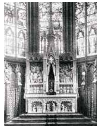
Autel du miracle