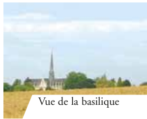
Vue de la basilique