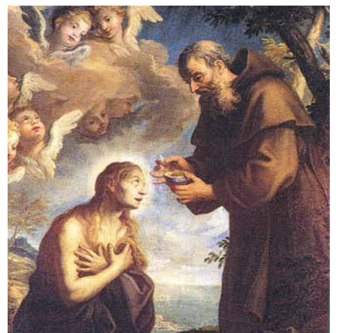
Sainte Marie Egiziaca – Collection Musée Diocésain de Milan

Nous savons qu'à l'âge de 12 ans, Marie Egiziaca quitta ses parents pour aller à Alexandrie. Elle mena pendant 17 ans une vie très dissolue. Elle vit un jour un navire avec un équipage étrange. Elle leur demanda qui ils étaient et où ils allaient. Ils lui dirent qu'ils étaient des pèlerins qui se dirigeaient vers Jérusalem pour la fête de l'exaltation de la sainte croix. Elle décida de monter à bord ; arrivée à destination elle alla vers l'église, mais arrivée sur le seuil elle fut retenue par une force mystérieuse. Effrayée, elle leva les yeux vers une image de la Sainte Vierge et fut prise d'un grand repentir pour la vie coupable qu'elle avait menée jusque là. Elle put alors entrer dans l'église et adorer le bois sacré de la Croix. Mais elle ne resta pas longtemps. La Sainte Vierge lui avait dit : « Si tu traverses le Jourdain tu seras en paix ». Et le lendemain,