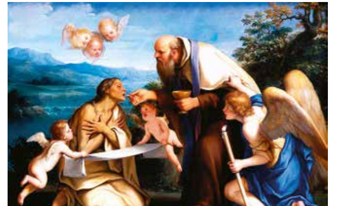
Marcantonio Franceschini – La dernière communion de sainte Marie Egiziaca – 1690