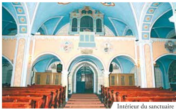
Intérieur du sanctuaire