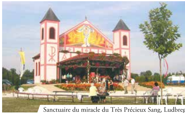
Sanctuaire du miracle du Très Précieux Sang, Ludbreg

La relique du sang est conservée parfaitement saine, intacte dans un ostensor commandé par la comtesse Eléonore Batthyany Strattm an en 1721.