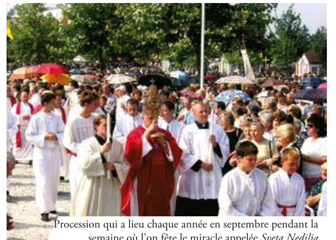
Procession qui a lieu chaque année en septembre pendant la semaine où l'on fête le miracle appelée Sveta Nedilja