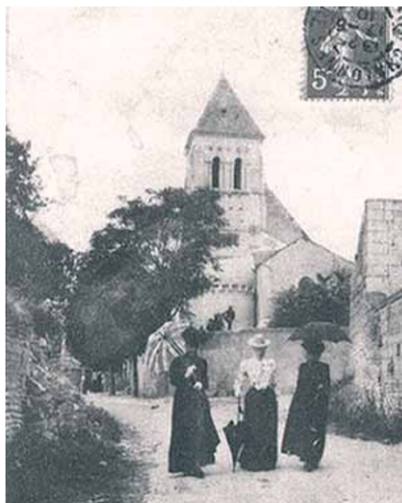
Église paroissiale des Hulmes