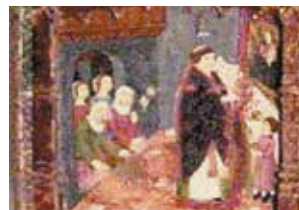
Détail d'un des tableaux présents à l'intérieur du sanctuaire qui représente la scène du vin renversé qui se transforme en sang