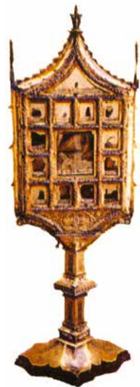
Ostensoir contenant les reliques du prodige