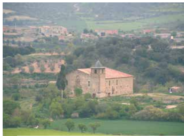
Sanctuaire où a eu lieu le miracle