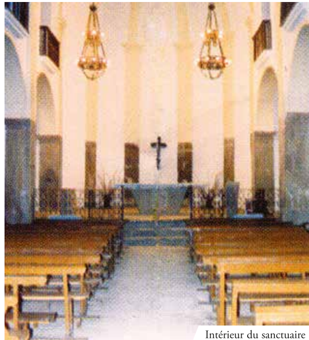
Intérieur du sanctuaire

Le curé de ce village avait de forts doutes sur la présence réelle du Christ dans l'Eucharistie. En 1010, un jour, tandis qu'il célébrait la messe, survint le miracle : le vin contenu dans le calice se changea complètement en sang vif. Actuellement les saintes reliques sont conservées dans un reliquaire gothique de 1426 qui contient la nappe de l'autel tachée de sang, ainsi que d'autres reliques données par le pape Serge IV à San Ermengol.