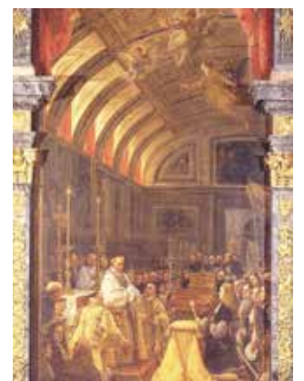
Tableau de Claudio Coello commandé par Charles II