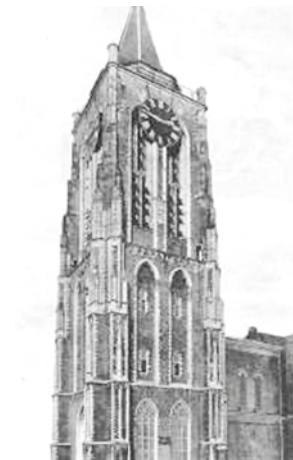
Église où eut lieu le miracle – Gorkum (Pays-Bas)