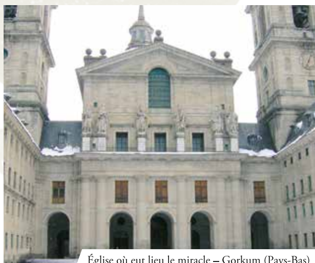
Église où eut lieu le miracle – Gorkum (Pays-Bas)