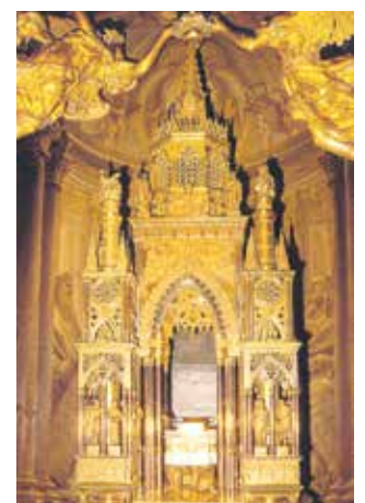
Église gothique dessinée par Vincente Lopez

La « Sagrada Forma » qui se conserve intacte encore de nos jours et est vénérée dans la sacristie du Monastère Royal de San Lorenzo de l'Escurial près de Madrid, fut profanée à Gorkum (aux Pays-Bas) en 1572 par quelques disciples de Zwingli (les « Gueux de la Mer ») à la solde du Prince d'Orange. Ceux-ci après avoir envahi la ville, commencèrent à la piller n'épargnant même pas la cathédrale. À peine entrés, ils frappèrent avec des barres de fer le tabernacle d'où ils prélevèrent l'ostensoir contenant le Saint-Sacrement. L'hostie fut jetée par terre et piétinée avec une botte à clous qui la transperça en trois endroits. Aussitôt de ces trous jaillit du sang vif et dans l'hostie se formèrent comme trois blessures en forme de cercles que l'on peut voir encore aujourd'hui. L'un des profanateurs, repenté et bouleversé de cette vision, avertit le chanoine