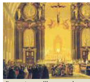
Procession en l'honneur du miracle. Dignitaires de la cour en adoration devant la « Sagrada Forma »