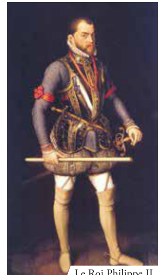
Le Roi Philippe II