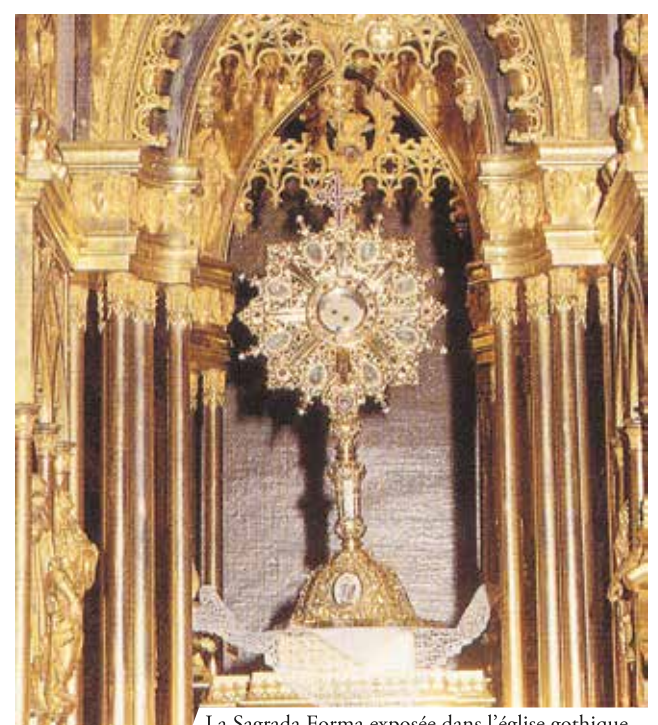
La Sagrada Forma exposée dans l'église gothique