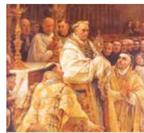
Détail du tableau de Claudio Coello