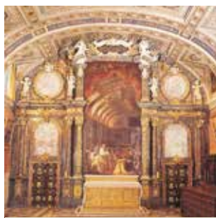
Autel où l'on conserve la peinture représentant la « Sagrada Forma »