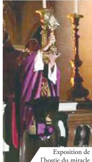
Exposition de l'hostie du miracle