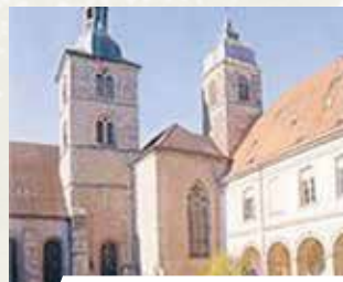
Basilica Minore, Favenerney