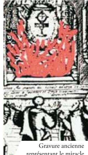
Gravure ancienne représentant le miracle