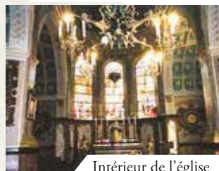
Intérieur de l'église