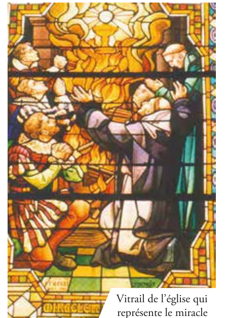
Vitrail de l'église qui représente le miracle

Àu XVII e siècle le protestantisme et le calvinisme se diffusèrent rapidement en France, à cause des avantages matériels, accordés par les nouvelles religions aux membres de la noblesse et du clergé, provenant de l'Église Catholique. L'incertitude entamait la foi de beaucoup de personnes, même dans les monastères. Il y avait à Favenerney une abbaye bénédictine dont les moines s'étaient éloignés de la règle de leur fondateur. Ils pratiquaient seulement le culte envers la Vierge de Notre-Dame la Blanche connue dans toute la contrée pour être miraculeuse. Par son intercession plusieurs miracles se produisirent, entre autres celui du retour à la vie de deux enfants pas encore baptisés. En 1608 à la veille de Pentecôte, les moines firent préparer un autel provisoire pour l'exposition et l'adoration du Saint-Sacrement. La lunette de l'ostensoir