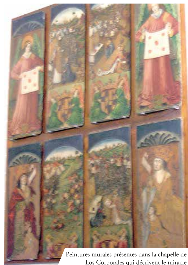
Peintures murales présentes dans la chapelle de Los Corporales qui décrivent le miracle