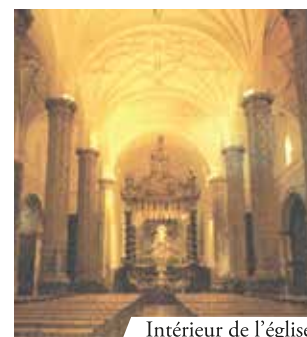
Intérieur de l'église