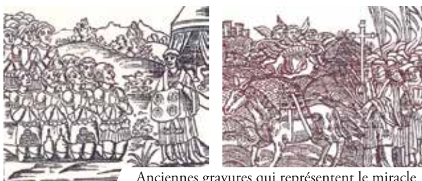
Anciennes gravures qui représentent le miracle