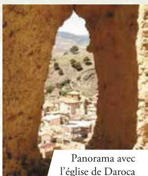
Panorama avec l'église de Daroca