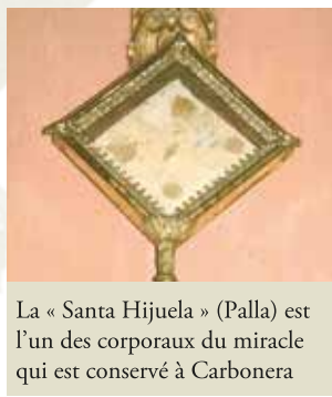
La « Santa Hijuela » (Palla) est l'un des corporaux du miracle qui est conservé à Carbonera