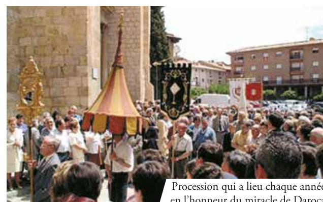
Procession qui a lieu chaque année en l'honneur du miracle de Daroca