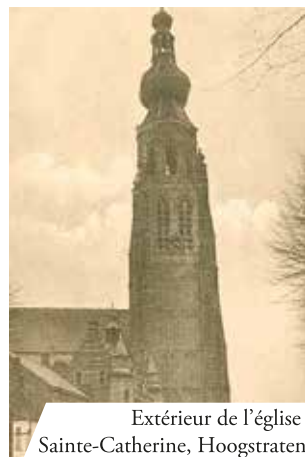
Extérieur de l'église Sainte-Catherine, Hoogstraten