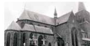
Le miracle eucharistique eut lieu dans l'église Saint-Pierre de Boxtel