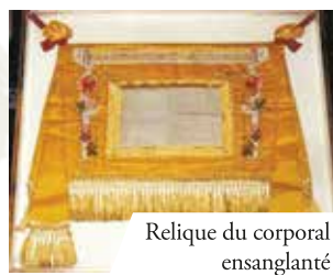
Relique du corporal ensanglanté