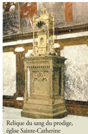
Relique du sang du prodige, église Sainte-Catherine