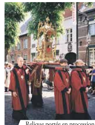
Relique portée en procession