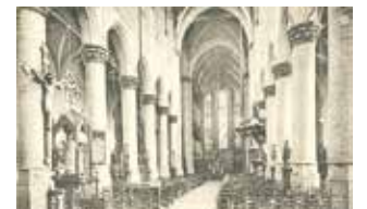
Intérieur de l'église