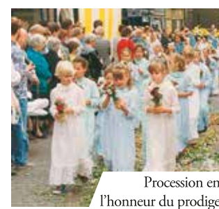
Procession en l'honneur du prodige

Le miracle eucharistique de Boxmeer advint dans l'église Saints-Pierre-et-Paul en 1400.