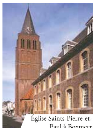
Église Saints-Pierre-et-Paul à Boxmeer