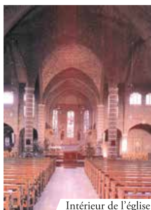
Intérieur de l'église