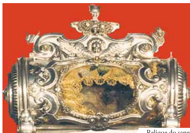
Relique du sang