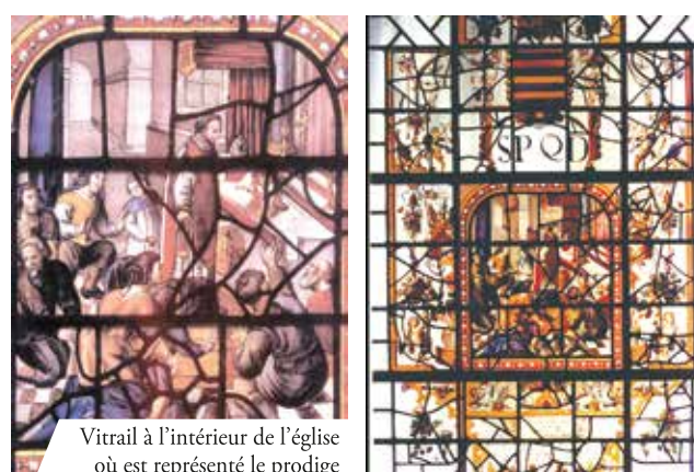
Vitrail à l'intérieur de l'église où est représenté le prodige