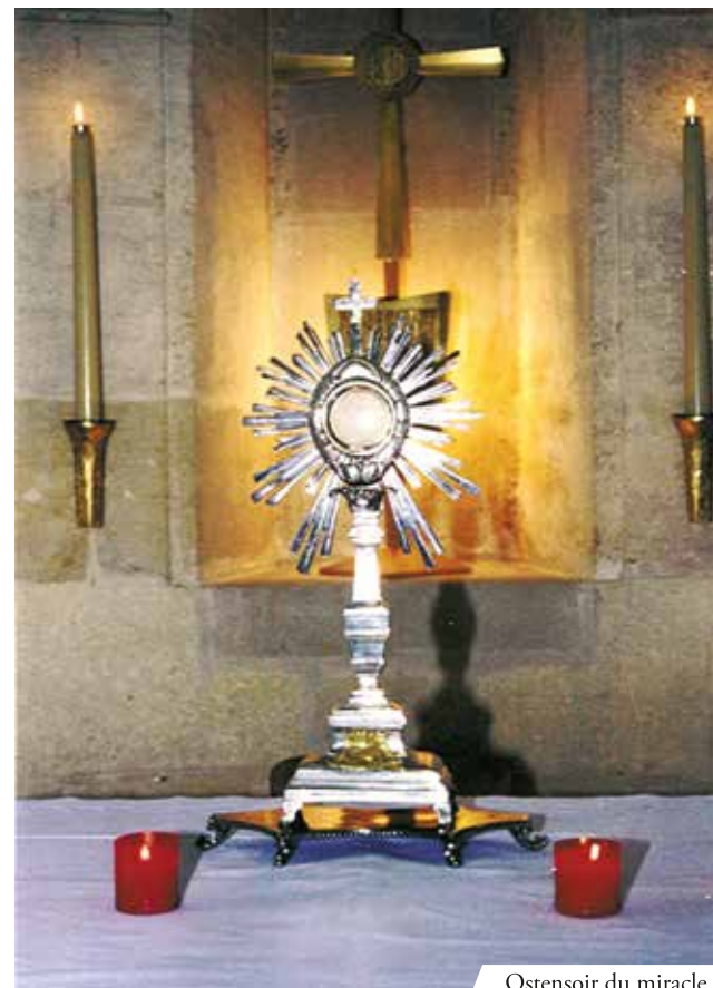
Ostensoir du miracle