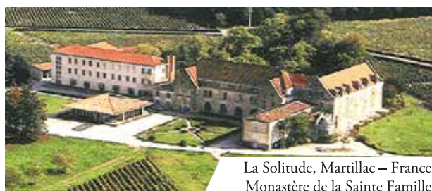
La Solitude, Martillac – France Monastère de la Sainte Famille