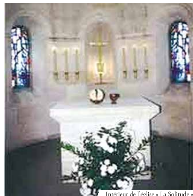
Intérieur de l'église « La Solitude »