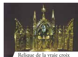
Relique de la vraie croix