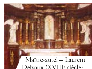
Maitre-autel – Laurent Delvaux (XVIII e siècle)