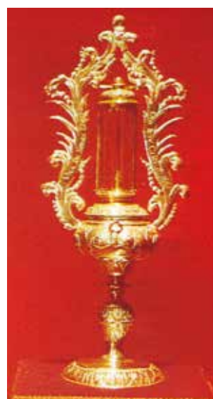
Relique d'une épine de la couronne de Jésus