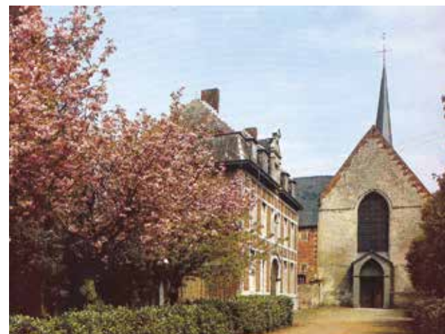
Abbaye des Prémontrés – Chapelle du Saint-Sang