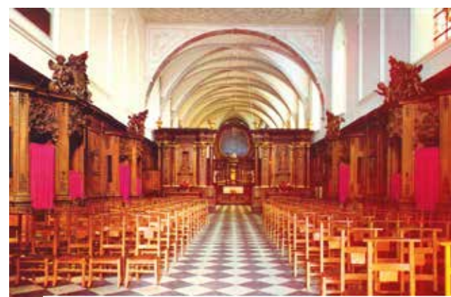
Intérieur de la chapelle du Saint-Sang