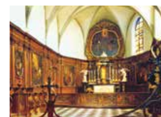
Choeur de la chapelle du Saint-Sang