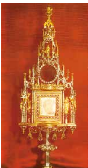
Relique du miracle eucharistique, le corporal taché de sang