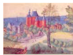
Tableau ancien du château et de l'abbaye de Bois-Seigneur-Isaac