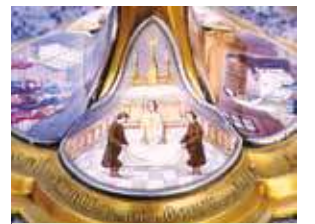
Détail des peintures qui ornent l'ostensoir