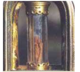
Châsse du XVII e siècle qui contient le tissu taché de sang conservé dans un tube de cristal à Blanot