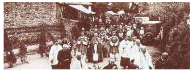
Procession en l'honneur du miracle