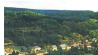
Vue du village de Blanot