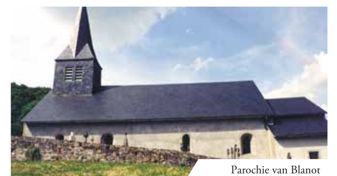
Paroche van Blanot

A u XIV e siècle à Blanot, petit village du centre de la France du diocèse d'Autun, l'évêque Pierre Bertrand fit faire une enquête canonique par son officiel de curie, Jean Jarossier, l'année même pendant laquelle eut lieu le miracle. C'est ainsi qu'on dispose aujourd'hui d'un rapport détaillé des faits. « Le jour de Pâques 1331 à la première heure, le père Hugues de la Baume, vicaire de Blanot, célébra la première messe. En donnant la communion à Jacqueline, veuve de Regnaut d'Effour, une parcelle de l'hostie consacrée tomba sur la nappe soutenue par les deux prud'hommes dont l'un s'appelait Thomas Caillot. Dame Jacqueline ne s'aperçut de rien, mais Thomas qui soutenait la nappe vit de son côté la petite partie qui était tombée. Il avertit le prêtre qui était en train de déposer le ciboire sur l'autel. "Révérend père, veuillez vous tourner vers nous car le